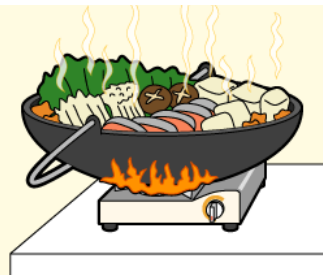
大きな調理器具を使用しない