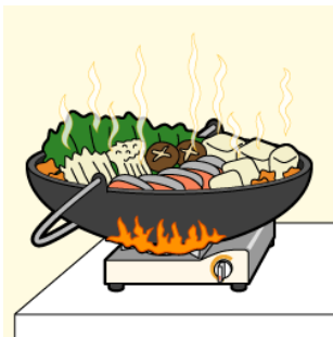
大きな調理器具を使用しない