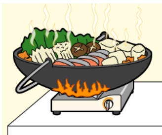
大きな調理器具を使用しない