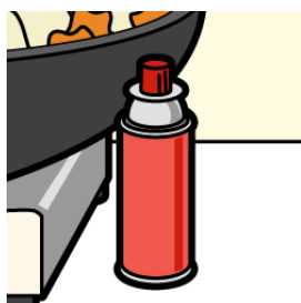
コンロの付近にボンベを置かない