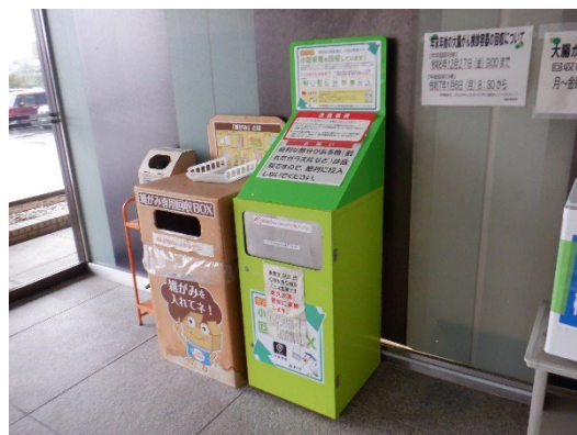
使用済小型家電回収 BOX