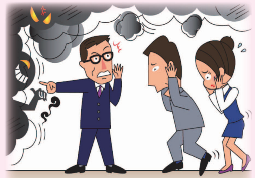
天井付近の煙は突然下降し始める！

煙の広がる速さは、無風時で横方向は毎秒 0.2 ～ 0.5m、縦方向は 3m ～ 5mです。特に階段部分はあっという間に煙が充満し、危険な状態になります。横方向は人の歩く速さより遅いので、避難可能です。しかし、時間が経過すると天井の煙がいっせいに下降し、周囲が瞬時に見えなくなってしまいます。煙が天井に張り付いているうちに避難しましょう。