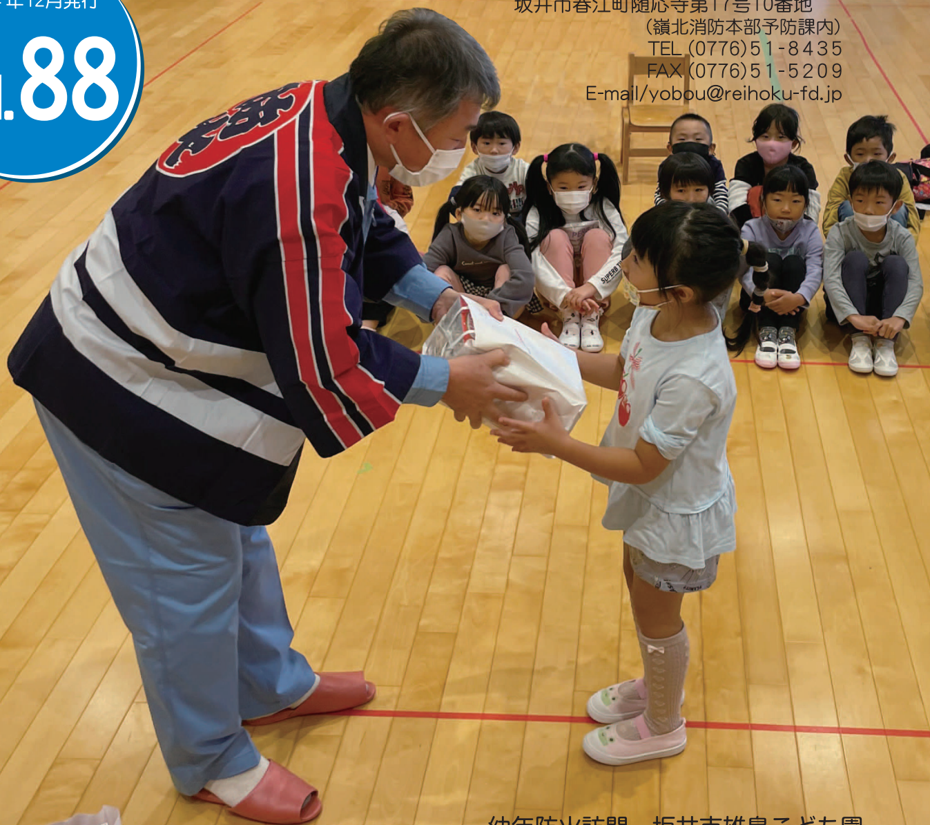
幼年防火訪問 坂井市雄島こども園